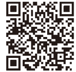
登録用二次元バーコード