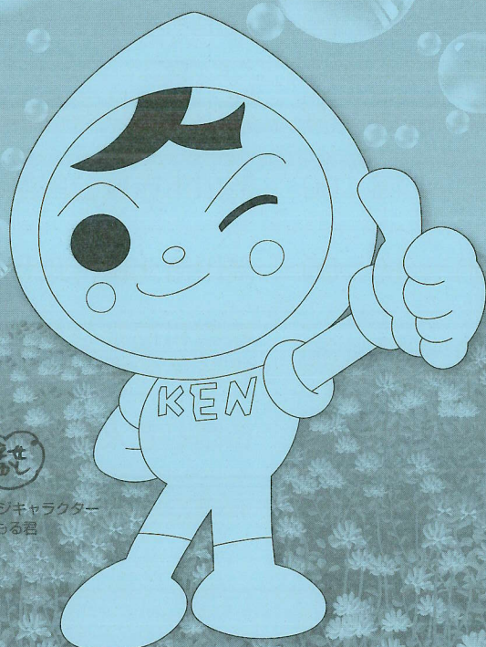
人権イメージキャラクター 人KENまわる君