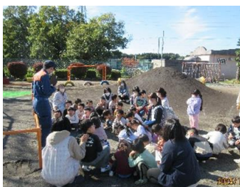
落ち着いて 避難できました。