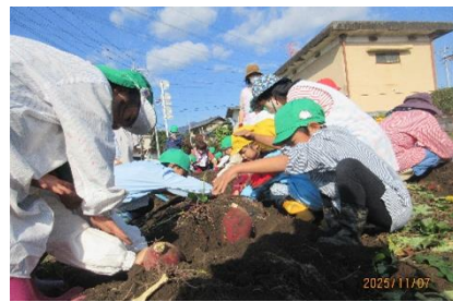
大きいものもあるよ！