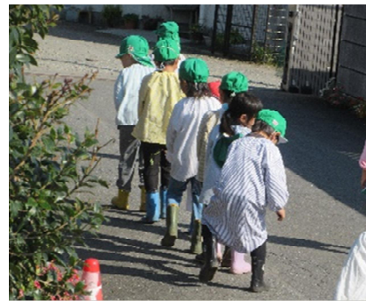
おいものついで 電車ごっこ