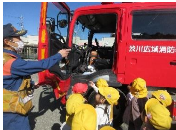
子どもたちは興味津々、いろいろ質問しました。