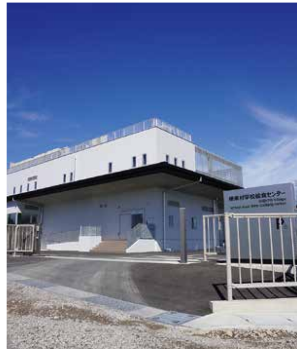
新 学校給食センター