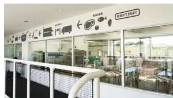
新学校給食センター見学スペース

水道の有収率とは 浄水場などから配水した水量のうち、実際に料金収入となった有収水量の割合を示す指標です。数値が高いほど、水道事業の経営が効率的であることを意味します。有収率が低い場合、漏水等が考えられます。