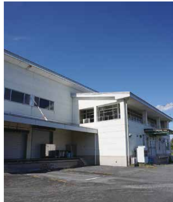
旧 学校給食センター