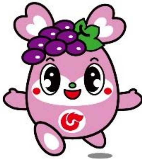
榛東村マスコットキャラクター しんとうちゃん