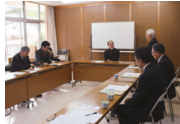
安曇野アートライン事務局長との懇談

安曇野アートラインは、北アルプスの麓に広がる安曇野に点在する19個の美術館・博物館を結び、安曇野市から白馬村までの約50kmのラインをさします。JR大糸線が地域内を縦断し、地域の南端にある長野自動車道安曇野インターからアクセスも良く、国道19号も安曇野市を交差して います。美術館・博物館の誘客には、鉄道・道路の利便性が求められますが、地域内の既設の県道が施設を結んでいると思いましたが、国道・鉄道も走っていない榛東村にとって観光客誘致を図るには、駒寄インターからの延伸道路を早期に開通させる必要性を痛感しました。