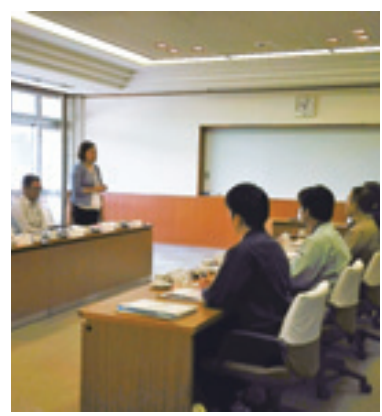
ゴミ減量化に対する職員の熱意を聞く

予算編成に向けて 提言書を提出 文教厚生常任委員会は、12月9日、4年間の視察研修をまとめ「教育、子育て、健康・長寿、環境衛生」分野の7事項21項目の提言書を村長及び教育長に提出しました。