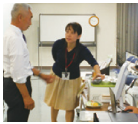
食育S.A.Tシステムを体験

健康長寿で村を活性化 北中城村は、平成22年の女性の平均寿命が89・0歳と2期連続全国1位の村です。しかし、65歳未満の死亡率は全国平均より高い状況です。そこで、糖尿病等生活習慣病やそれらの重症化、合併症にならないために、食育S.A.Tシステムを活用し、企業やコンビニなどに出品、働く世代にも健康教育を実施しています。また、他の課や企業と連携した行事も開催し、健康づくりの取り組みを多方面へ展開・連携することで、 平均寿命日本一の継続↓薬しみや生きがいの増加↓医療や福祉関係費の健全化↓地域コミュニティの活性化↓産業観光振興↓村の税収増に繋げようとしています。村の長所と短所を結びつけた全庁的な取り組みは大変参考になりました。本村でも、多方面と連携した健康づくりの取り組みを望みます。 ※フードモデル(模型)を選んだのせいで、瞬時に栄養価などを計算し、「食事バランスガイド」などを表示してくれるシステムです。