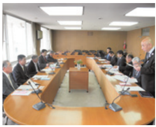
大河ドラマ誘致の話に聞き入る

産業振興・観光振興を学ぶ 津幡町では、平成27年4月に設けた津幡町産業振興計画に基づき、同町の特性や課題に対し、移転企業に対する優遇、助成措置、国際見本市等への出店事業費助成、雇用に関する奨励金、新分野進出・新製品開発支援、設備投資に対する助成など産業振興に取り組み、既存事業所の活性化や移転企業などの進出に努めているとのことでした。 また、観光振興は、源平合戦の「倶利伽羅峠の戦い」の舞台となった倶利伽羅峠が同町にあることから、平成21年に「津幡町大河ドラマ誘致推進協議会」と「津幡町大河ドラマ誘致推進実行委員会」を設けて、様々な誘致活動を展開してまいりました。 本村では、産業振興計画は策定していませんが、既存事業所の活性化や企業の発展のための支援など、検討する必要があると思います。